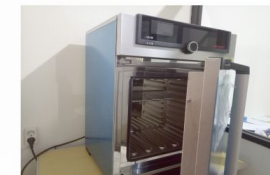
Oven Model UN 55 Memmert USA