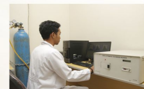
Pembacaan Dosis TLD