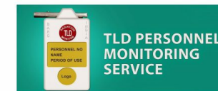
TLD BARC (LABELING)