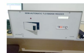
TLD BARC T1010 S Nucleonic India