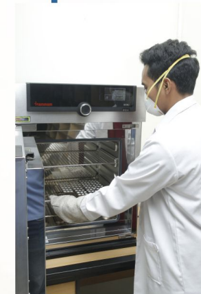
Proses Annealing TLD