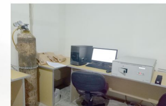
PC Software untuk TLD BARC T1010 S Nucleonic India